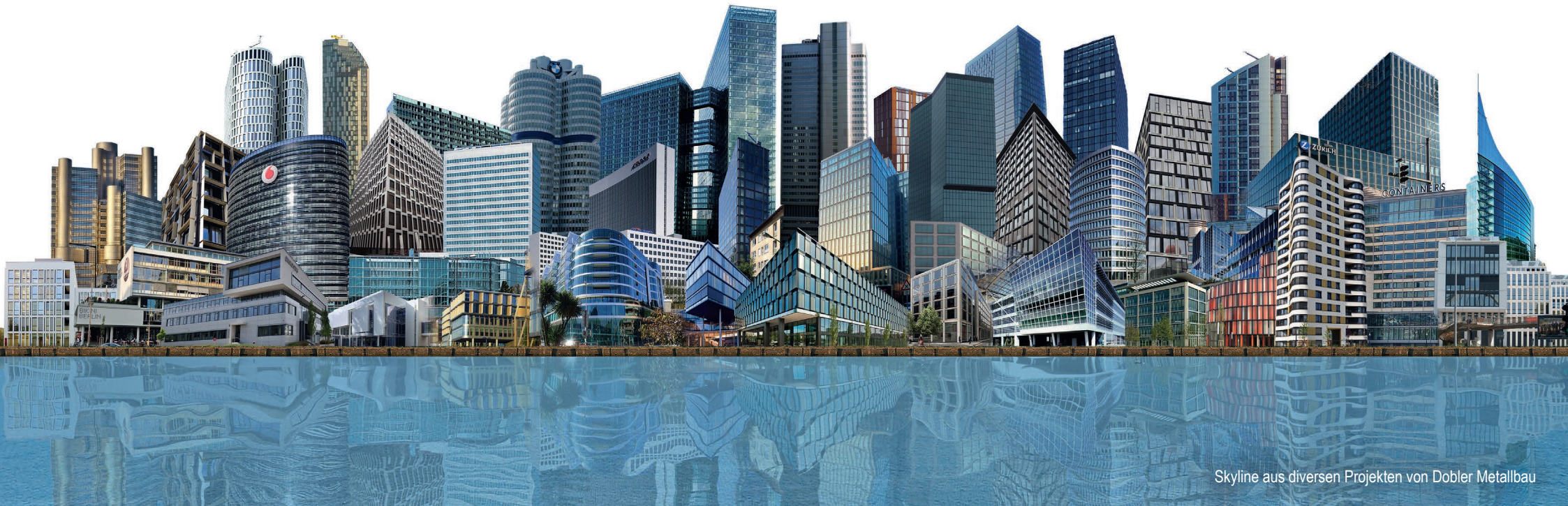
Skyline aus diversen Projekten von Dobler Metallbau